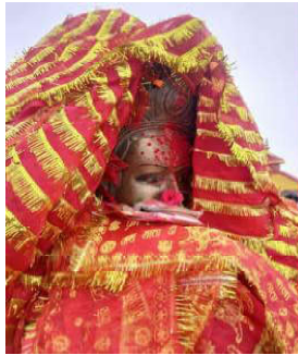
तेथ्युमको पाथीभारा माता