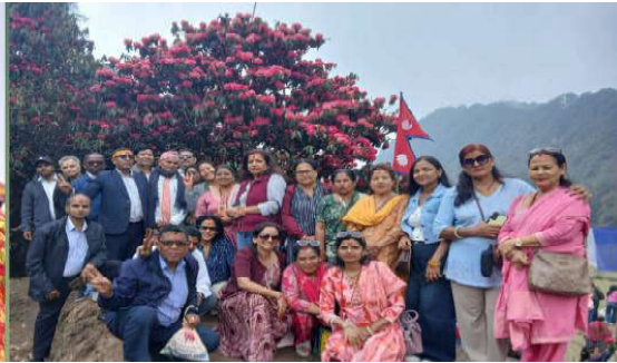
लाली गुराँसमा रमाउँदै आन्तरिक पर्यटकहरू

विराटनगर। कोशी प्रदेशको तेथ्युम जिल्लामा पर्ने पूर्वी नेपालको तिनजुरे, मिल्के, जलजले क्षेत्र अन्तर्गत पर्ने तीनजुरे पाथीभारामाताका दरवार पुग्दा समग्र गुराँस फुलेट राताम्य बनेको आकर्षक दृष्यले पर्यटक वढ्दै गएको छ। डाँडाकाडाका फुलेको फुलेले पर्यटकहरूको आकर्षणको विन्दु बनेको छ।