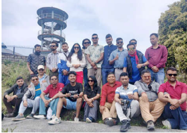
मोरंग केरावारी गाउँपालिका वडा नं. २ सिंहवानी जेफालेमा रहेको भ्यू टावर।

जेफाले पर्यटन विकास समितिका सदस्य भीम ठकुरीका